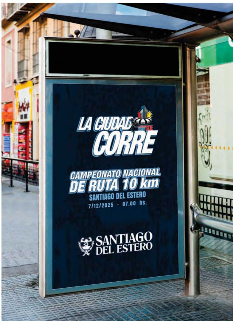
PANTALLAS / TOTEM LED