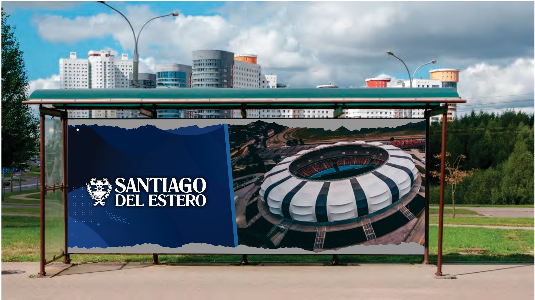
PARADA DE COLECTIVO, REFUGIO