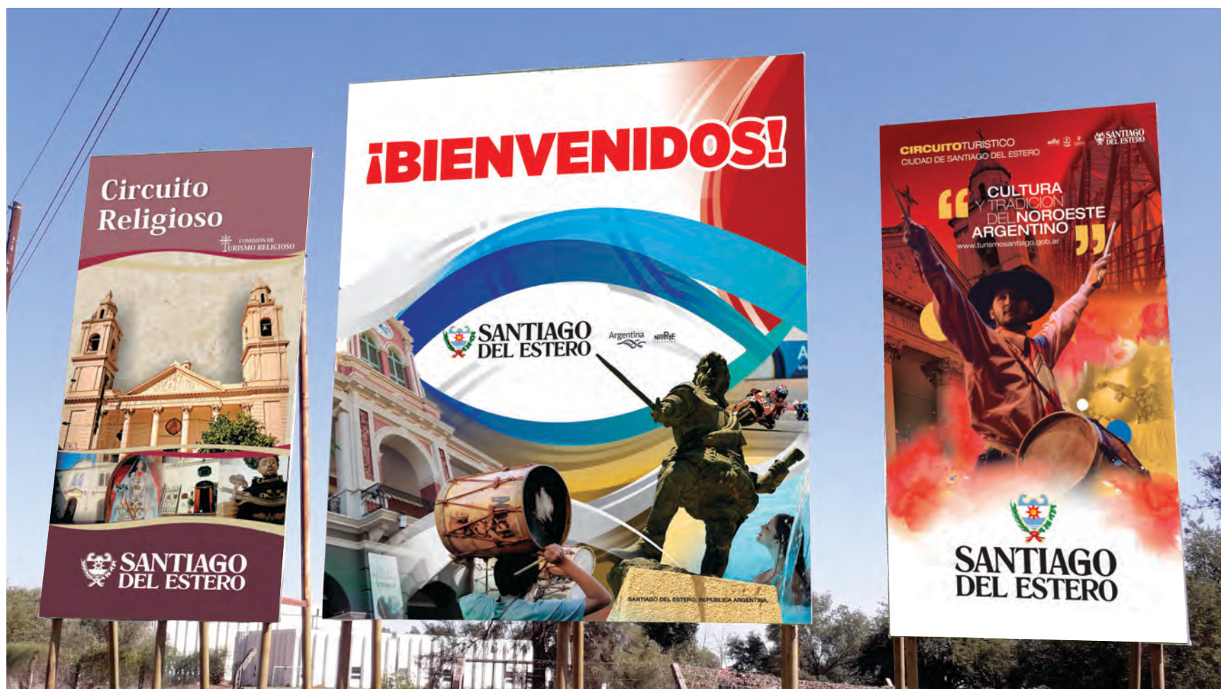
INGRESO A "LA ISLA"