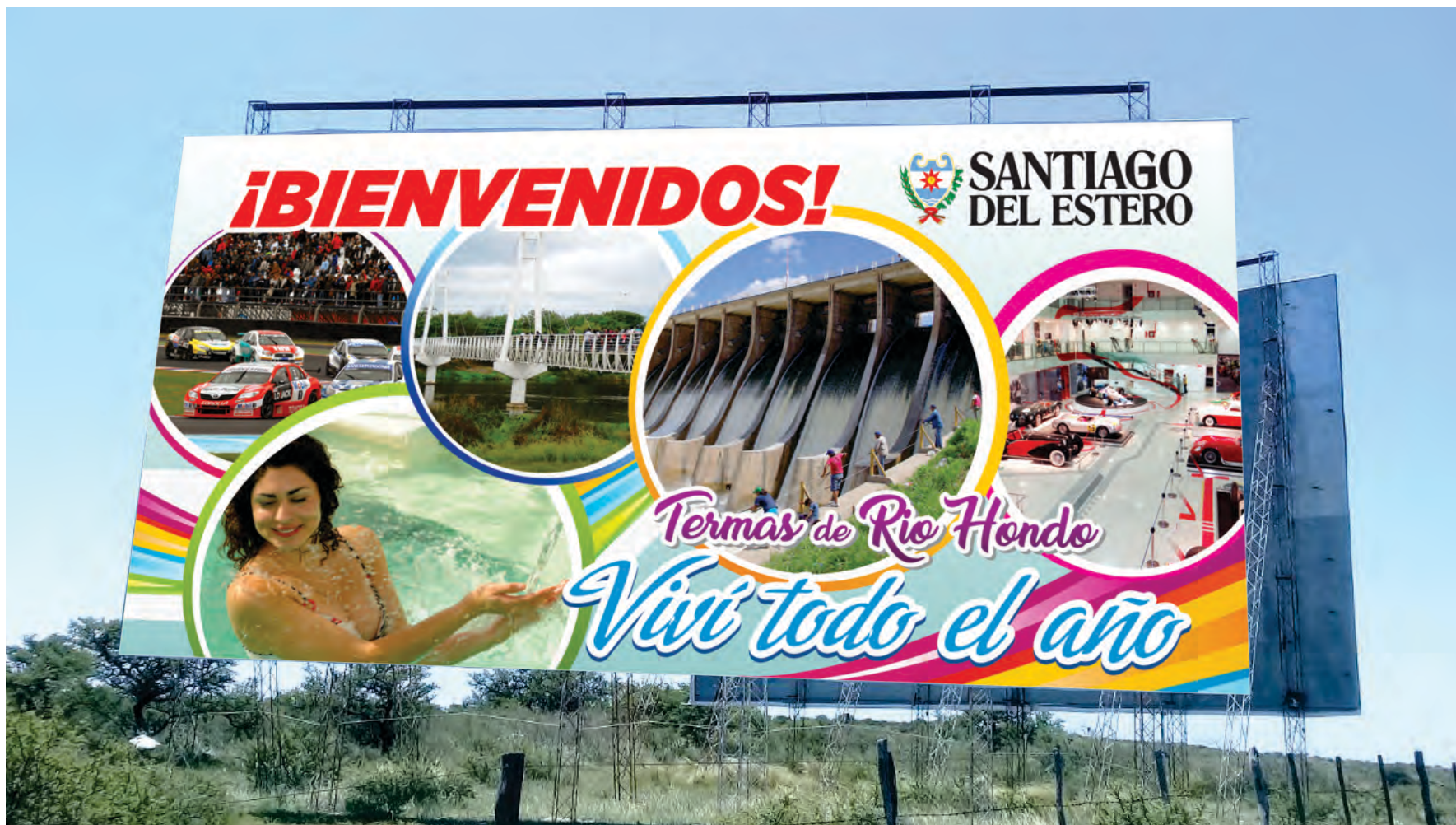
INGRESO A LA PROVINCIA